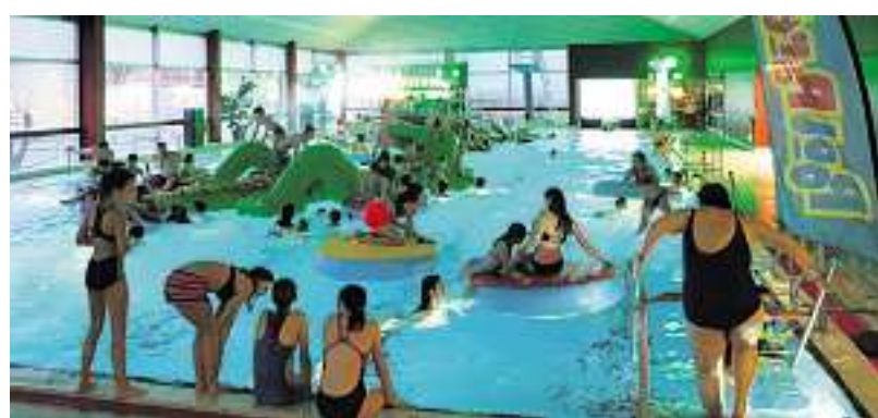
Beats und Bässe im kühlen Nass: die erste Pool-Party im Dora-Rau-Bad war ein voller Erfolg.