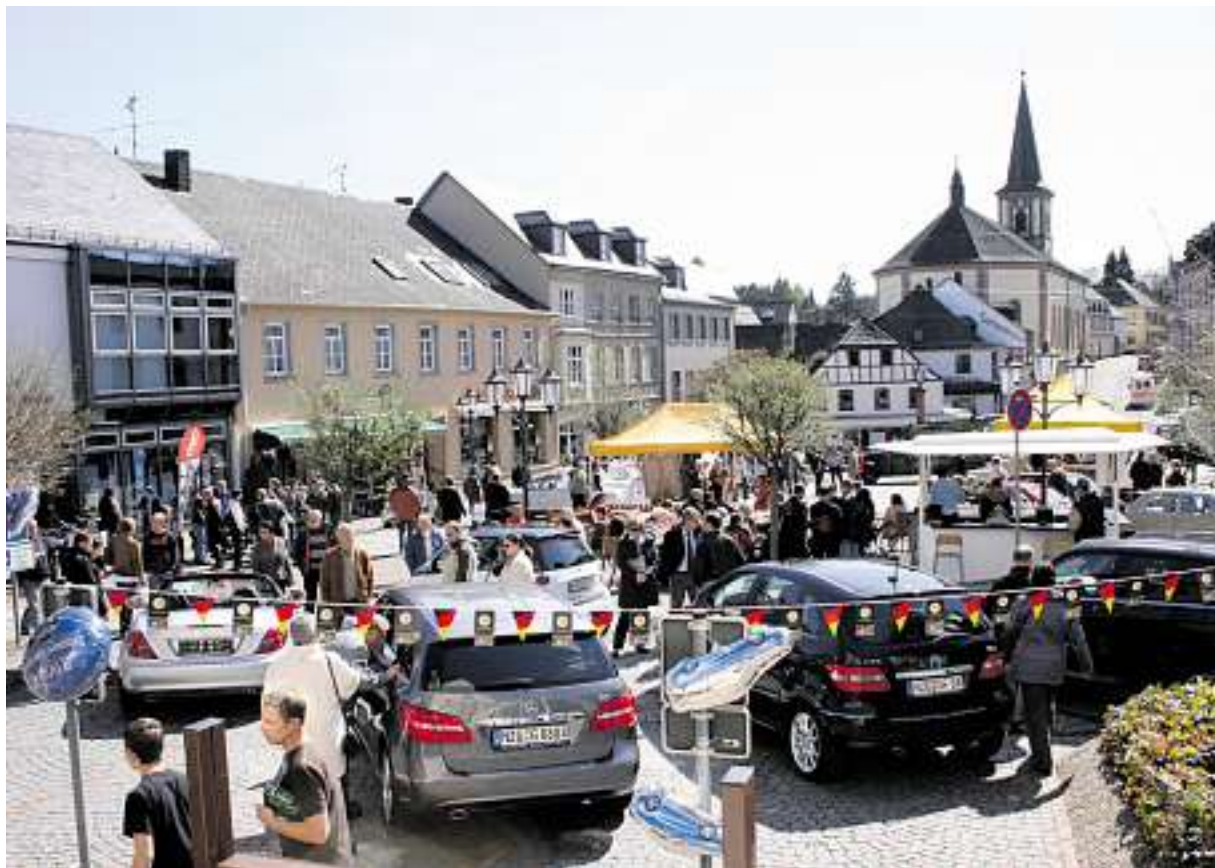
Autos, Kunst und Kulinarik rund um den Marktplatz in Wadern

Gastronomisch werden die Gäste von den Wirten rund um den Marktplatz bestens versorgt. Auf zum Frühlingbeginn nach Wadern, und genießen Sie die ersten warmen Strahlen in der Außengastronomie!