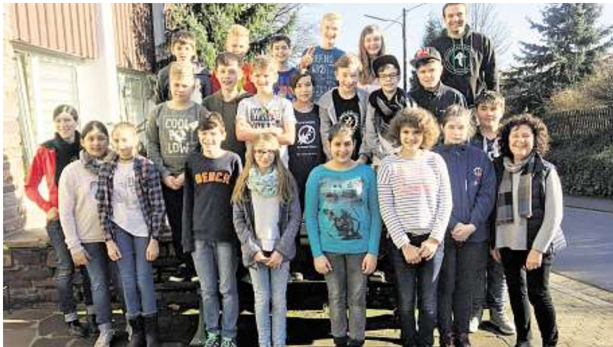
Mediatoren-Team der Waderner Schulen.

Gemeinsame Schulung der Graf-Anton-Schule und des Hochwald-Gymnasiums Wadern