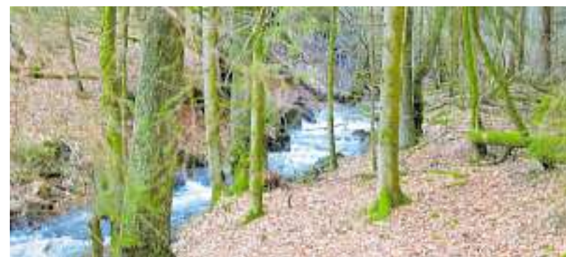
Der Wahnbach bei Morscholz.

Durch die Steinberger Wälder und auf dem Saar-Hunsrück-Steig